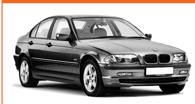
BMW 3 E46