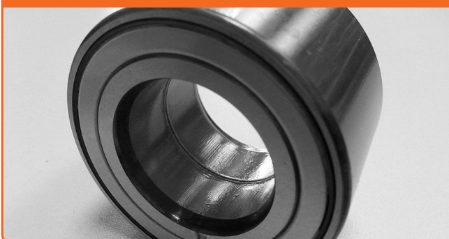
KITS DE ROLAMENTO DA RODA