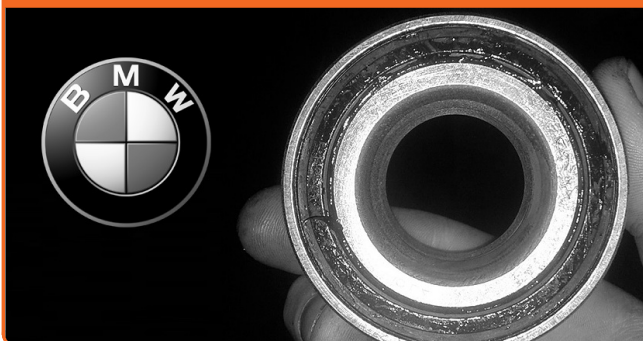
KITS DE ROLAMENTO DA RODA PARA BMW